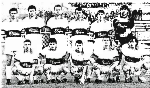
Sopra, un undici del Gualdo, promosso in C1